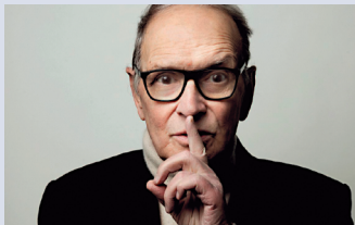
Ennio Moricone – Der Maestro