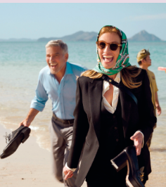
Ticket ins Paradies