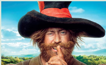
Der Räuber Hotzenplotz