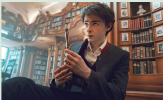
The Magic Flute