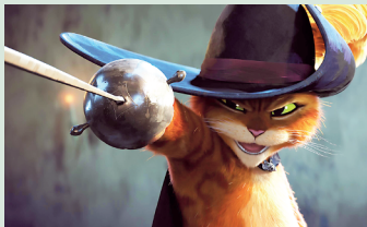
Der gestiefelte Kater