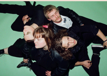
12.05. Bipolar Feminin