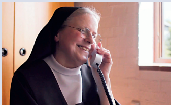
Wo ist Gott?