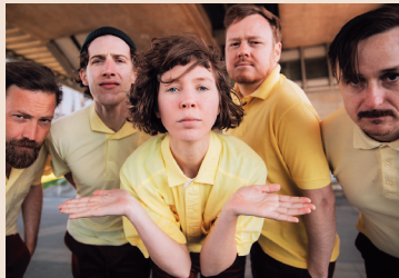
06.04. 5K HD