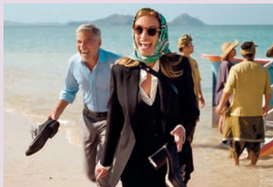
Ticket ins Paradies