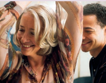
Meine Stunden mit Leo