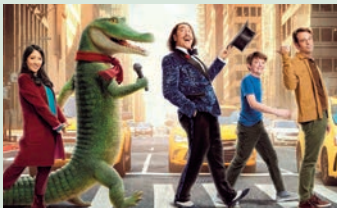
Lyle – Mein Freund das Krokodil