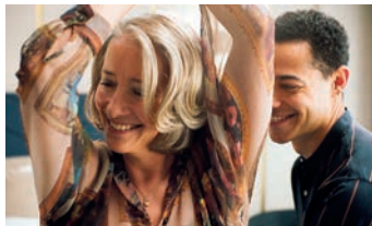
Meine Stunden mit Leo