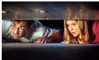
Was dein Herz dir sagt