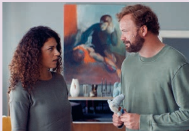
Love Machine 2