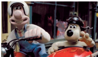
Wallace and Gromit: Unter Schafen

Alle Details zur Langen Nacht der Forschung finden Sie unter https://langenachtderforschung.at