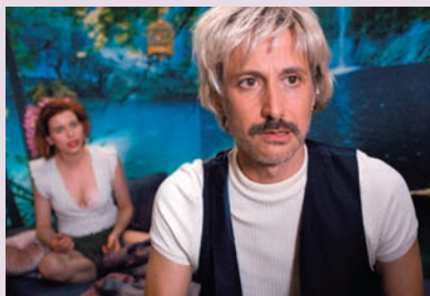
Der Onkel – The Hawk