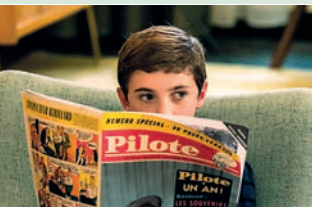
Der kleine Nick

Der 9-jährige Franz wäre gerne cool. Aufgrund seiner Größe und der Locken wird er immer wieder für ein Mädchen gehalten. Sobald er sich aufregt, wird die Stimme hoch und piepsig. Mit Hilfe eines Internet-Tutorials will er an seiner Coolness arbeiten und ein richtiger Mann werden. Christine Nöstlingers Klassiker wurde mit einem österreichisch-deutschen All-Star Ensemble erstmals verfilmt.