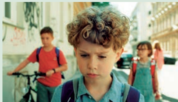
Geschichten vom Franz