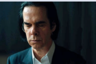
This Much I Know To Be True

Lady Dianas Todestag jährt sich heuer zum 25. Mal. Der Oscar-nominierte Regisseur Ed Perkins nimmt uns mit auf eine Zeitreise. Er erzählt in einer faszinierenden Montage, in der er ausschließlich Originalmaterial wie TV-Berichte, Interviews und Talkshows verwendet, über ihr Leben, ihre Persönlichkeit und ihren tragischen Tod. „Muss man gesehen haben!“ (Variety)