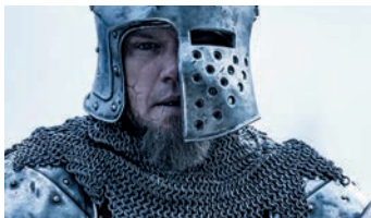
The Last Duel