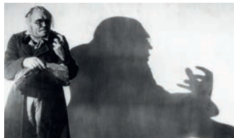
Das Cabinet des Dr. Caligari