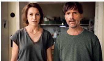
Es ist nur eine Phase, Hase

Wer sagt die Wahrheit? Ridley Scott schildert in seinem starbesetzten Historiendrama einen wahren Fall aus dem 14. Jahrhundert aus drei Perspektiven. Marguerite de Carrouges beschuldigt Jacques Le Gris, einen Günstling des Fürsten, sie vergewaltigt zu haben. Doch dieser entgeht erfolgreich der Klage. Als letzten Ausweg sieht Marguerites Ehemann ein Gottesurteil: ein Ritterduell auf Leben und Tod.