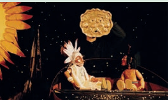
Der zur Sonne ging