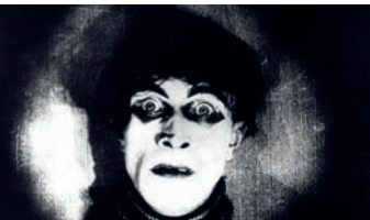
Das Cabinet des Dr. Caligari