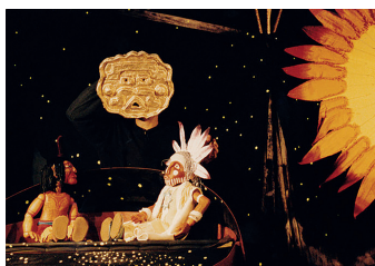
Der zur Sonne ging