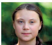
I am Greta