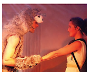
Anna und der Wolf